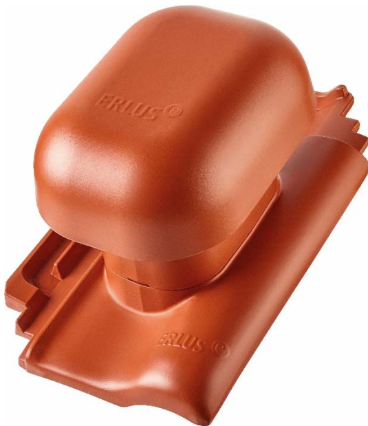
Bild 5: Der neue ALU-Raumlüfter sorgt für guten Luftaustausch in Wohn- und Küchenräumen.

Im Bereich ALU-SYSTEM Zubehör gibt es ab sofort den ALU-Raumlüfter DN 150 von ERLUS. Er sieht aus wie der bisherige DN 125 und fügt sich durch seine optimale Formensprache harmonisch auf dem Dach ein. Der neue Raumlüfter hat aber einen deutlich größeren strömungsoptimierten Durchgang und Deckel. Der Raumlüfter mit hohem Volumenstrom wird fertig montiert geliefert und ist für Wohnraum-, Küchen- und Wrasenlüftungen geeignet.