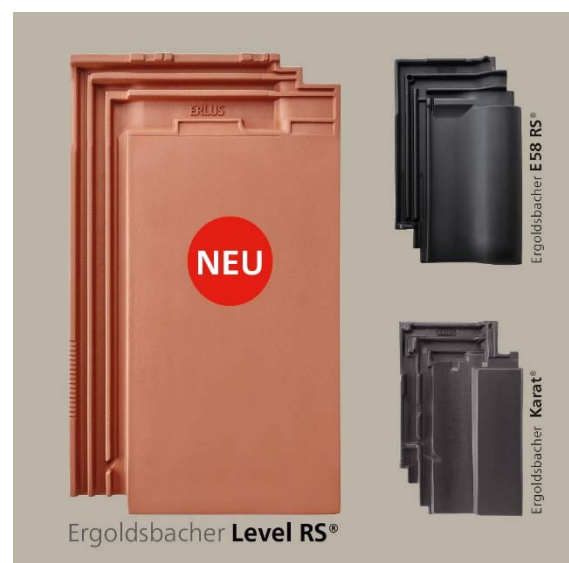
Bild 4: Der neue Ergoldsbacher Level RS ® , der Ergoldsbacher E 58 RS ® und der Ergoldsbacher Karat ® .