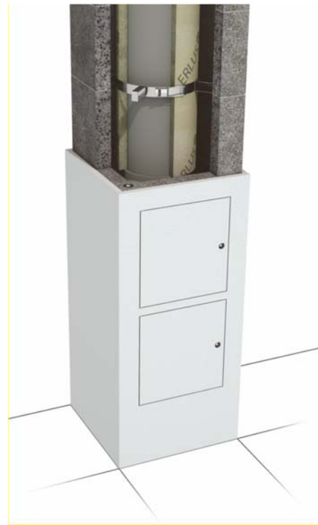
Bild 6: Die neue ERLUS Designtür wird auf der Messe Dach + Holz in Stuttgart im Januar 2020 vorgestellt. Die Designtür kann je nach Wohnraum in Farbe und Struktur an die Optik angepasst werden. Grafik: ERLUS

Struktur der Wand im Wohnraum angepasst werden, bevor sie in den vorab montierten Rahmen am Schornsteinfuß eingepasst werden. Dadurch wird die Putz Tür für den Schornsteinfeger nahezu unsichtbar integriert. Die neuen Designtüren sind für einzügige LAF-Premiumschornsteine in den Durchmessern 16, 18 und 20 Zentimeter verfügbar.