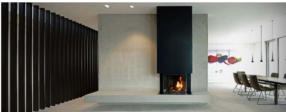
Bild 7: Panoramakamin aus Stahl. Ofendesign von Rogmans