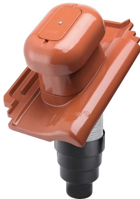
Bild 2: Alle ALU-SYSTEM Teile sind extrem robust, korrosionsbeständig, form- und farbstabil. Das Bild zeigt den ERLUS Sanitärlüfter.

Für alle ALU-SYSTEM-Teile gilt, sie bleiben formstabil – auch bei Hitze oder schweren Lasten (Eis, Schnee). Das Baukastensystem lässt sich einfach lagern, transportieren und montieren. Außerdem ist das ERLUS ALU-SYSTEM nachhaltig: Muss das Dach einmal zurückgebaut werden, lassen sich die Teile sogar problemlos demonstrieren und als Wertstoff recyceln.