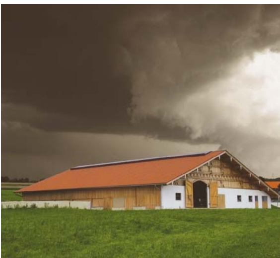
Bild 1: ERLUS bietet ein hagelzertifiziertes Dachsortiment an.

Die neue ERLUS Hagelbroschüre gibt es in den Sprachen Deutsch, Englisch, Französisch und Polnisch zum Download unter www.erlus.com/Hagel .