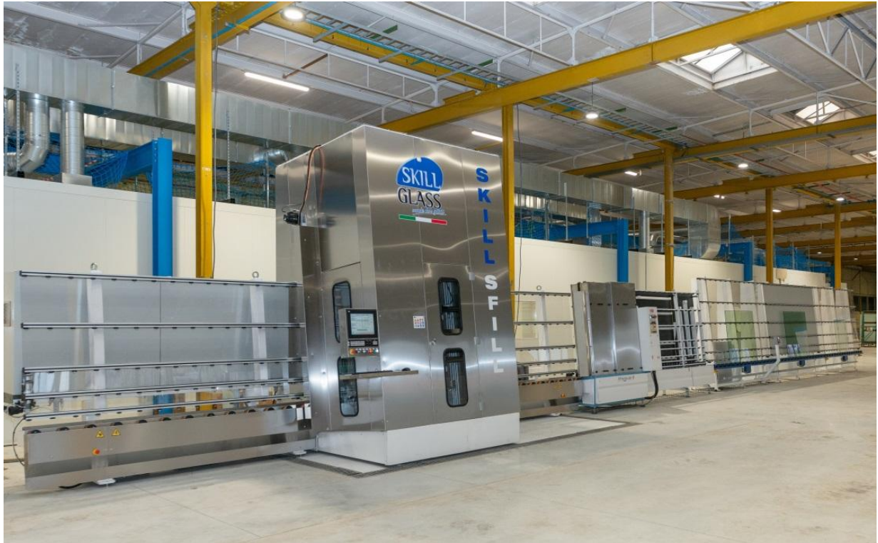
Bild 2: Der Start des Aufbaus der Produktionsanlagen lag zu Beginn des Jahres, inzwischen ist er abgeschlossen.