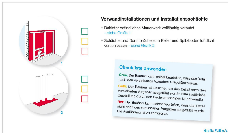
Bild 1: Rot, Gelb oder Grün? Das Ampelsystem der neuen FLiB-Checkliste für Mauerwerksbau leitet Bauherren bei der Entscheidung: Können sie selbst die Ausführung eines luftdichten Details als korrekt oder fehlerhaft einstufen oder sollten sie besser den baubegleitenden Sachverständigen fragen?