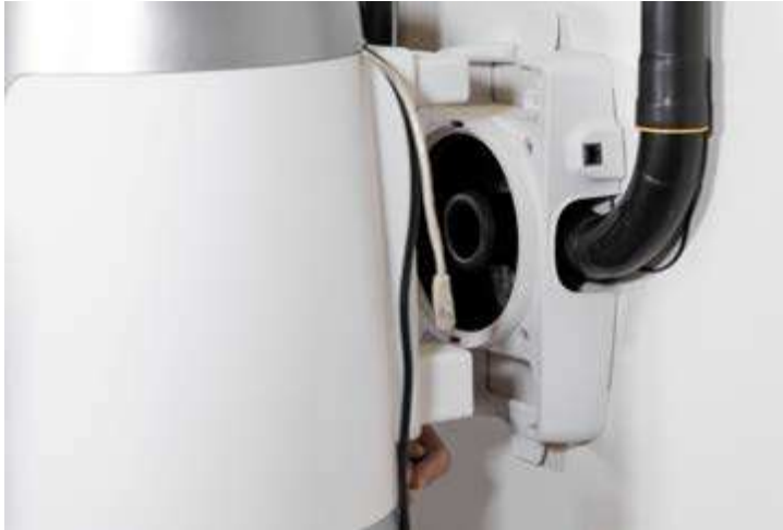
Der 360° Schnellverschluss des allaway Staubbehälters lässt sich im Handumdrehen öffnen

Behälters und sorgt insgesamt für Handlichkeit. Die Wandhalterung der Einheit besteht aus einem Montagesockel und einer Wandhalterung – montierbar für rechts- oder linkshändige Nutzung – und ist durch einen 180° Schnellverschluss ruckzuck montiert. Die Verrohrung erfolgt direkt mit den allaway Rohren.