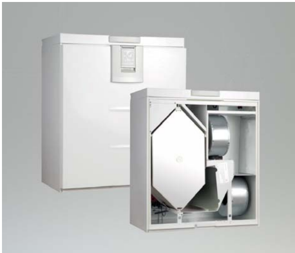
Bild 2: Vallox rüstet seine Professional Line wie das ValloPlus 240 MV-E mit Enthalpie-Wärmetauschern aus.