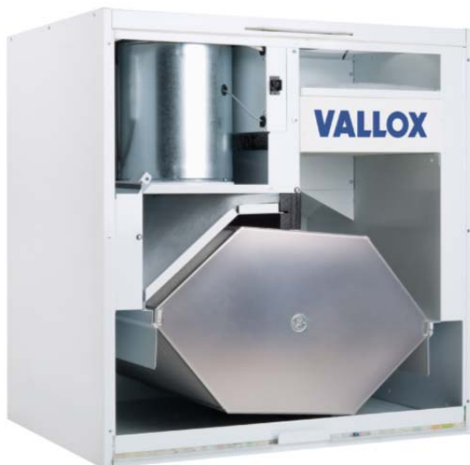
Bild 3: ValloPlus MV-E – ein Gerät der Extraklasse mit Enthalpie-Wärmetauscher und intelligenter Steuerung