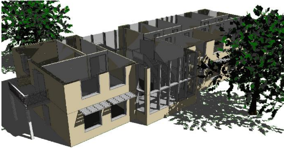
Bild 2: Verschattung realistisch darstellen und minutengenau berechnen