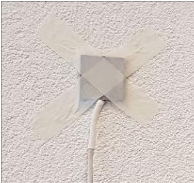
Bild 2: Mit dem Wärmeflussensor kann der U-Wert sicher bestimmt werden.