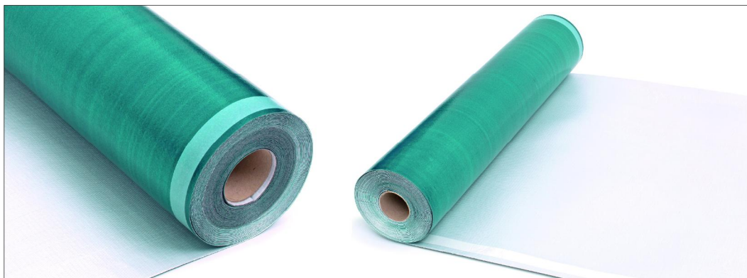
Bild 1: Die jafo-HERMETIC® Abdichtungsbahn ist in Breiten bis zu 100 cm erhältlich und extrem reißfest. Sie ist besonders einfach und schnell auf der Baustelle zu verarbeiten.