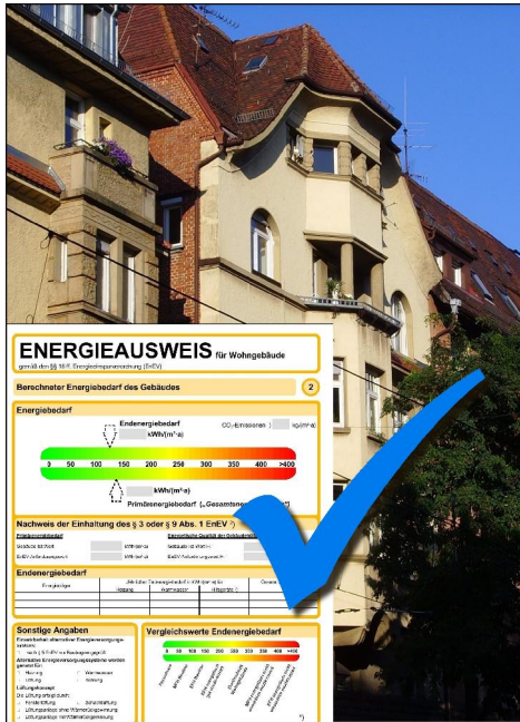
Bild 1: Den richtigen Energieausweis im Wohnbestand können Verkäufer und Vermieter anhand der Checkliste in www.EnEV-online.de auswählen.